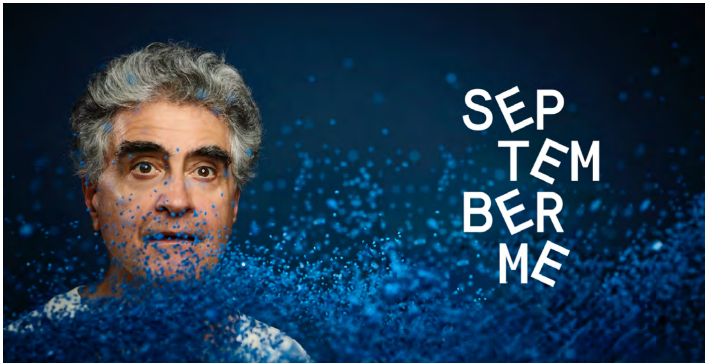
banner September Me 2025 met artist in focus Renaud Garcia-Fons