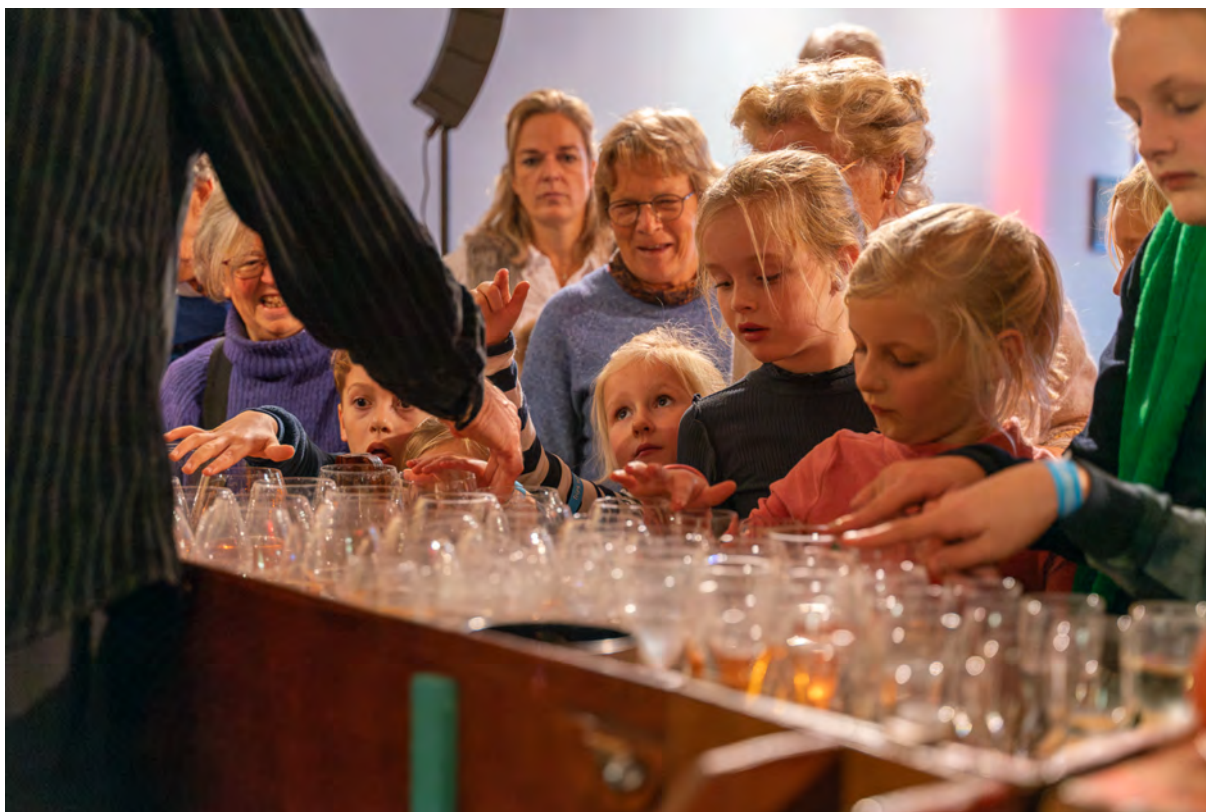
Glasorgel van Rogier Kappers

Met een actief marketingbeleid heeft September Me ook haar landelijke zichtbaarheid vergroot. Met publicaties in NRC, Volkskrant en de Groene Amsterdammer, de uitzending van een concert door NTR Radio 4 en aankondigingen in een breed palet van tijdschriften en kranten heeft September Me haar zichtbaarheid op lokaal, regionaal en nationaal niveau kunnen vergroten. Met een aanzienlijke worteling in de stad en regio heeft September Me haar impact op en haar waarde voor de stad en regio sterk vergroot.