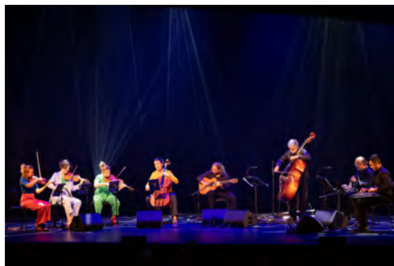
openingsconcert 'The Breath of Strings' met artist in focus Renaud Garcia-Fons

September Me stelt een maandelijkse concertserie samen die het samen met Flint presenteert in de St. Aegtenkapel. Met een avontuurlijk programma, waarin de grenzen tussen muziekstijlen en disciplines versmelten, zet het een ontwikkeling in het klassieke en hedendaagse muzikaanbod in de stad en regio in gang. Ook biedt deze concertserie September Me de kans om haar publiek vast te houden en uit te breiden.