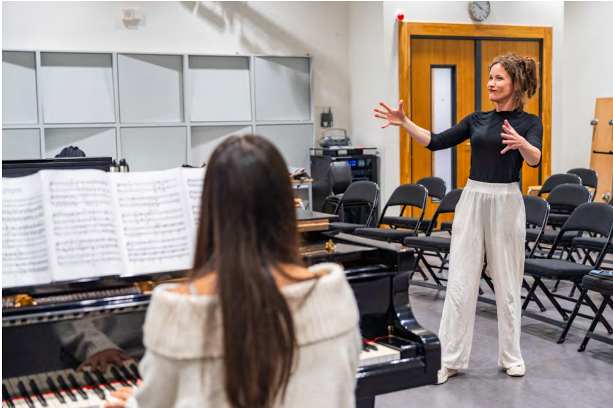
September Me Academie