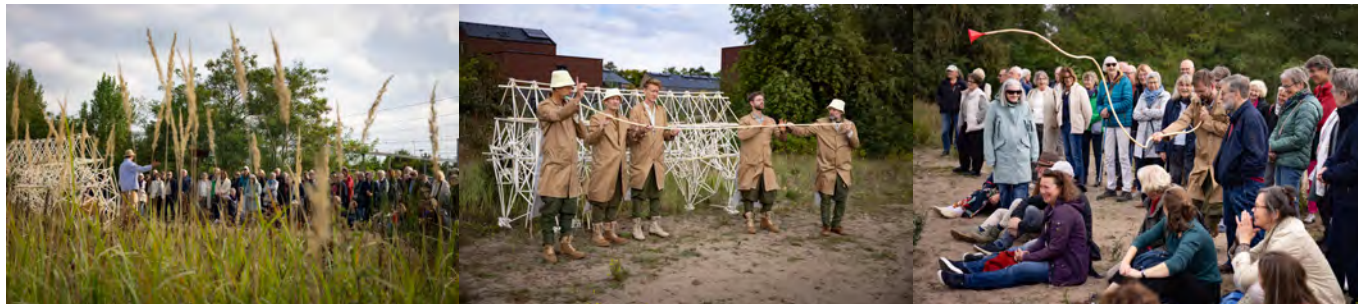
'strandbeest' door Calefax

Ook heeft September Me de diversiteit van het publiek met het bezoek van ruim 200 nieuwkomers in Amersfoort bij verschillende concerten in het programma kunnen vergroten. Met het verdiepingsprogramma en de September Me Academie verrijkte en verdiepte het de publieksrelatie. Een uitvoerig verslag is te lezen in hoofdstuk 3: Marketing en publieksbereik.