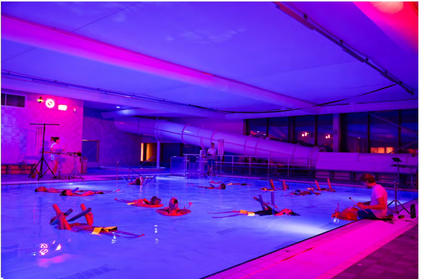
één van de uitvoeringen van (onder)waterconcert 'Waterwerken' in zwembad Amerena in Amersfoort

Speciaal voor September Me werd hoofdlocatie Flint omgetoverd tot een muzikaal en sfeerful festivalhart waar je kon verdwalen in een aansprekend verdiepingsprogramma en kon genieten van bijzondere dinerconcerten. Ook vonden concerten verspreid door de stad plaats in Theater de Lieve Vrouw, De Veerensmederij en een nabijgelegen buitenlocatie, St. Aegtenkapel en zwembad Amerena.