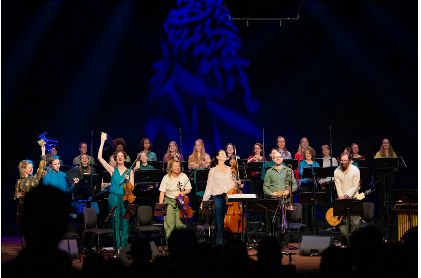
'Little Blue Something' Nationaal Vrouwen Jeugdkoor, Ragazze Quartet e.a. September Me 2025

'We hebben de lessen in de September Me Academie als zeer inspirerend ervaren, waarbij de verschillende benaderingswijzen van de coaching sessies echt een meerwaarde was.'