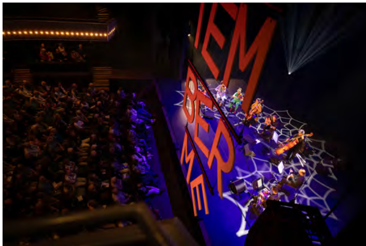
openingsconcert 'Breath of Strings'