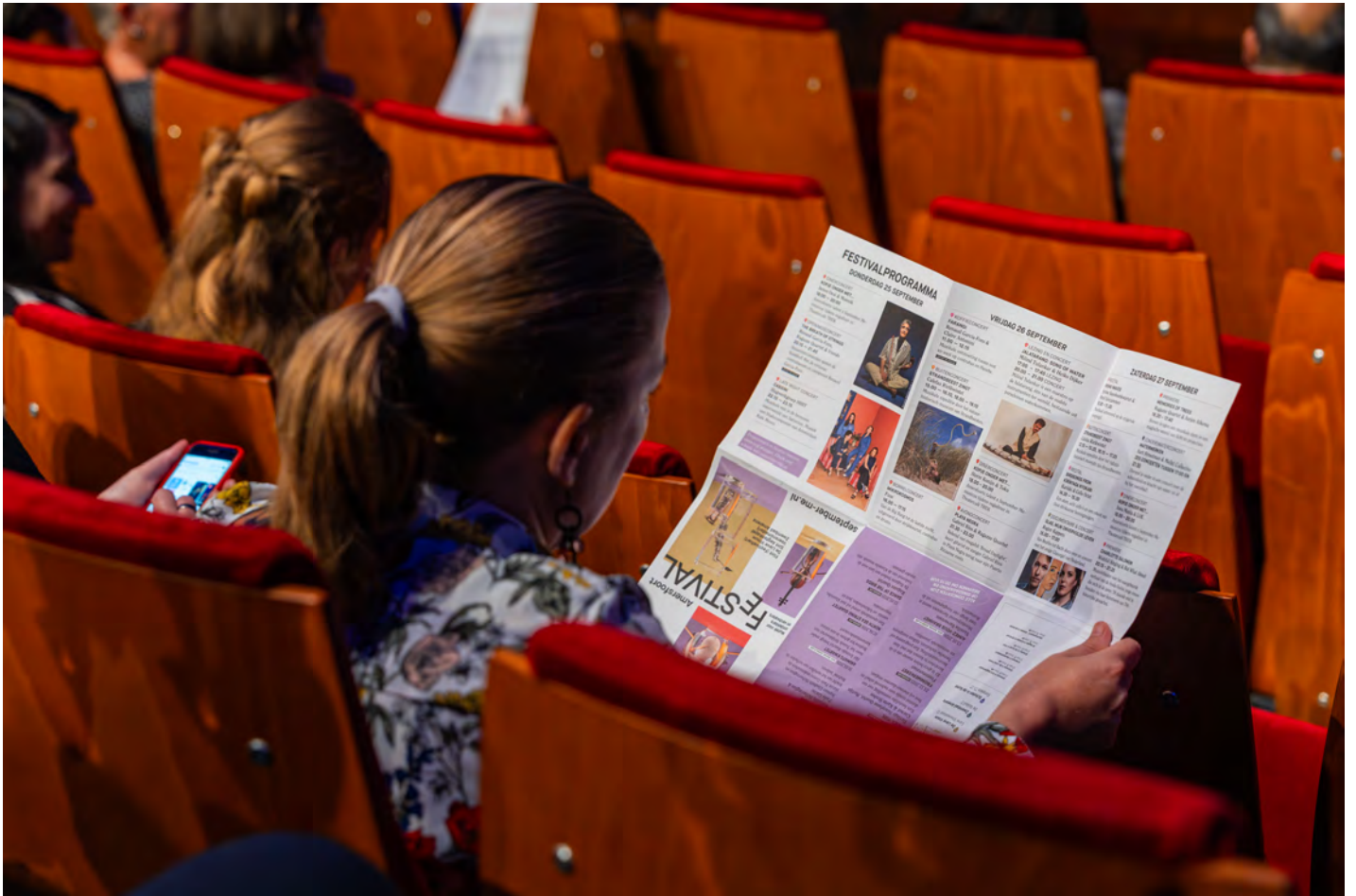
September Me 2025