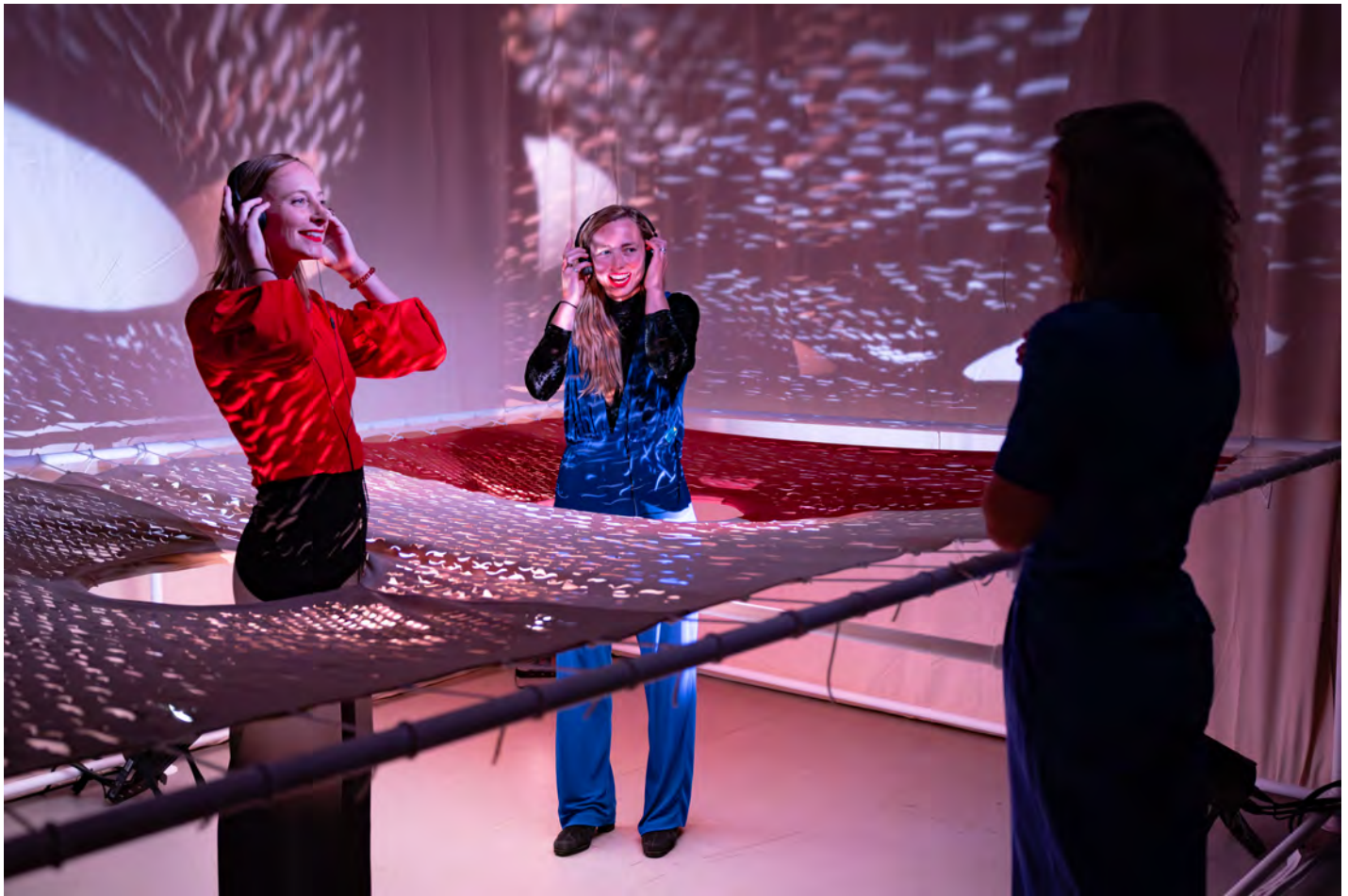
'grenzen' van Nande Overtoom contextprogramma 2025