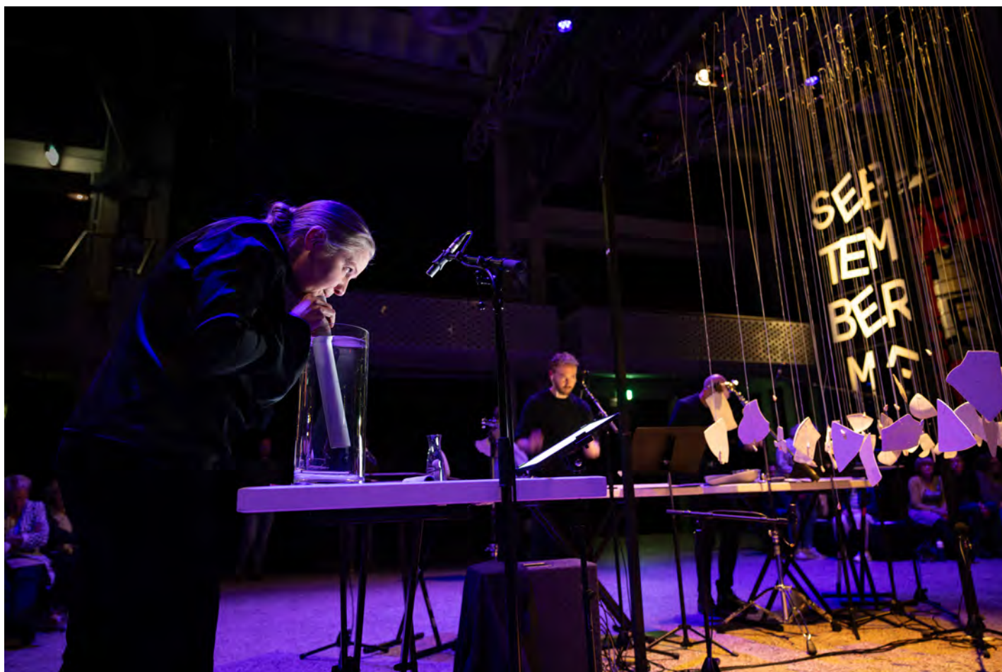
late night concert 'Cassini' door HIIIIT